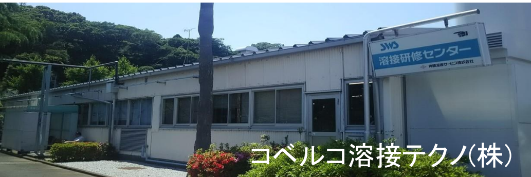
コベルコ溶接テクノ(株)